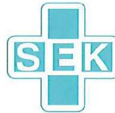
図-4 SEK マーク