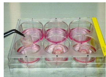
図-1 三次元培養モデル

上記のうちOECD TG431, 439及び492では図-1に示した三次元培養モデルを用います。これは直径1cmほどの小さなカップの底にヒト由来の細胞を播種、培養したものです。このほかにも、OECD TG437はウシ摘出角膜、OECD TG438はニワトリ摘出眼球を用いる等、様々な種類の試験法があります。