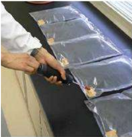
ガス検知管による試験風景