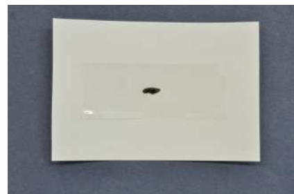
粘着テープで台紙に貼りつける