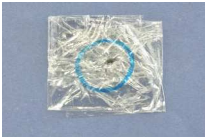
ラップフィルムで包む