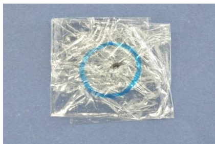
ラップフィルムで包む