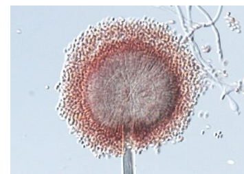
クロコウジカビ ( A.niger )