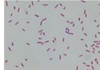
大腸菌 ( E.coli )