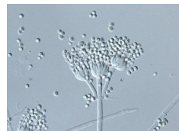
アオカビ ( P.citrinum )